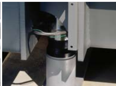
Accesos opcionales para montajes (en foso)